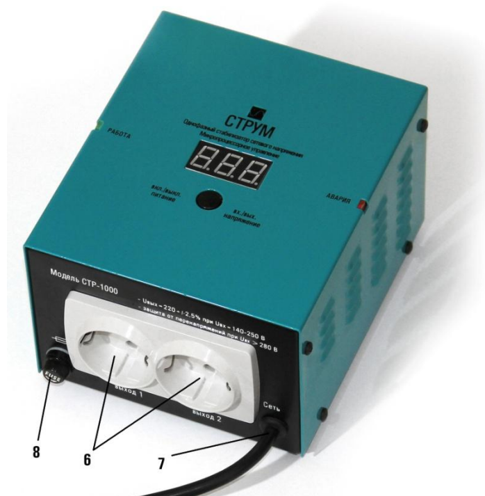
Рис.2 Верхняя панель стабилизатора.

3 – рычаг автоматического выключателя при возведении которого производится включение стабилизатора