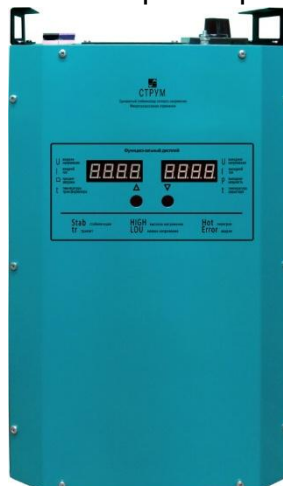
Рис.1 Лицевая панель стабилизатора напряжения

На лицевой панели корпуса (рис. 1) расположены следующие органы управления: