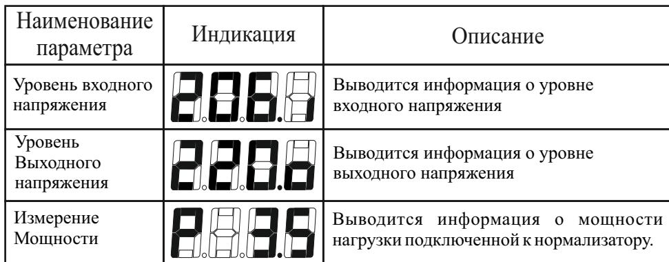
Таблица 3 Режимы измерений и индикации

После включения нормализатора, цифровое табло отображает входное напряжение. Значок <I> в правом нижнем углу указывает на измерение входного напряжения.