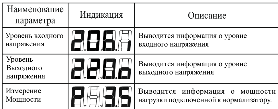
Таблица 3 Режимы измерений и индикации

После включения нормализатора, цифровое табло отображает входное напряжение. Значок <I> в правом нижнем углу указывает на измерение входного напряжения.