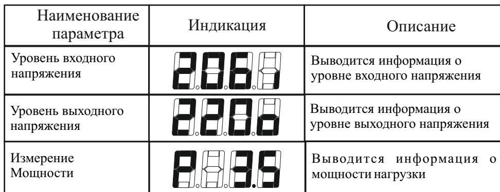
Таблица 8. Режимы измерений нормализатора.

После включения нормализатора, цифровое табло отображает входное напряжение. Значок <V> в правом нижнем углу указывает на измерение входного напряжения.