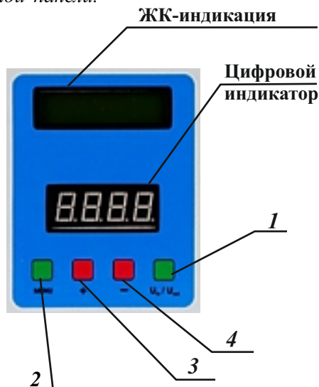
Рисунок 8. Информационная панель

В таблице 8 описаны режимы измерений и цифровой индикации нормализатора. В таблице 9 описаны сервисные сообщения (ЖК-индикация и речевые оповещения). Опционо нормализаторы FLAGMAN (по индивидуальному заказу) могут содержать речевой информатор дублирующий текстовые сообщения ЖК-индикации. В аварийных режимах нормализатора речевые оповещения включаются автоматически и повторяются 3 раза. Если необходимо прослушать информацию дополнительно, речевое оповещение активируется при нажатии любой кнопки информационной панели.