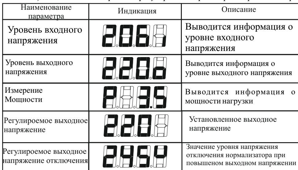
Таблица 5. Режимы измерений и регулировки параметров нормализатора

После включения нормализатора, цифровое табло отображает входное напряжение. Значок <I> в правом нижнем углу указывает на измерение входного напряжения.