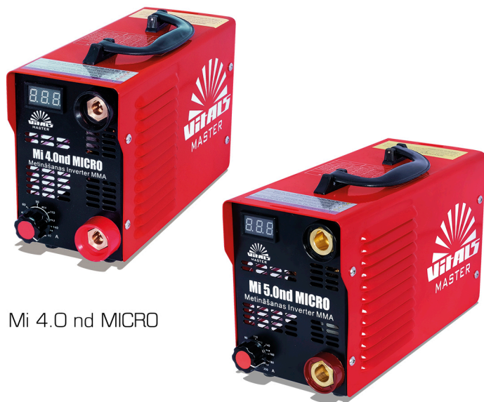
Mi 4.0 nd MICRO