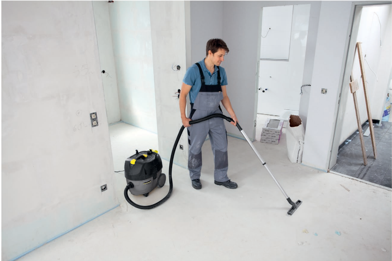
NT 25/1 Ap