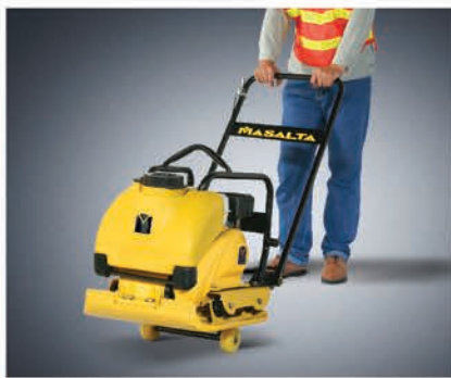
Транспортировочные колеса входят в комплект поставки.

В конструкции этой машины применены новейшие разработки в области эргономики и универсальности. Одновременно мощная и компактная, кроме стандартных видов работ MSR90 может укладывать плитку, горячий и холодный асфальт. Полиуретановый ковер и система орошения входят в комплект поставки.