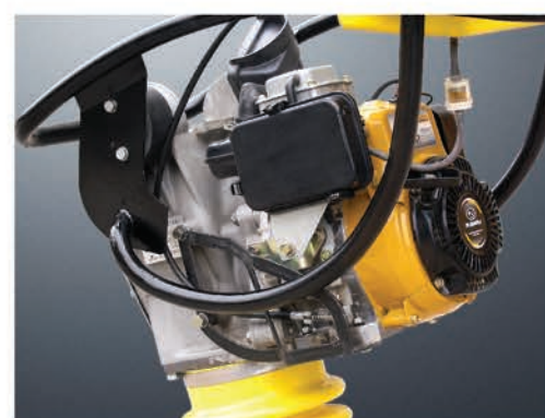
Специальная защитная рама для двигателя