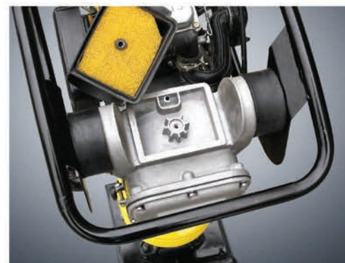
Дополнительная система очистки воздуха