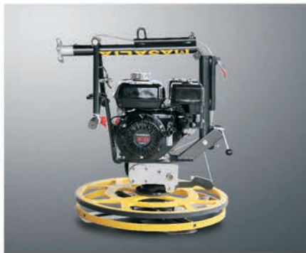
Складная ручка для удобства транспортировки и хранения.