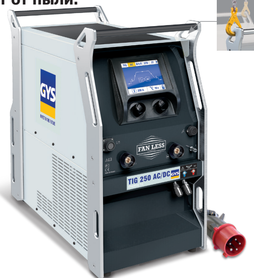
Аппарат поставляется без аксессуаров.