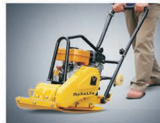
Ковер для укладки клинкерной плитки.