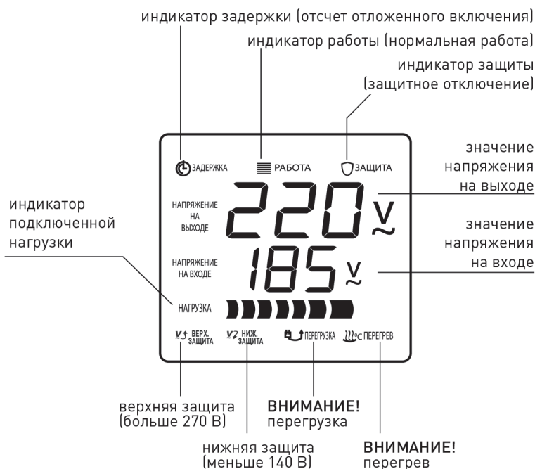
Индикация режимов работы стабилизатора.

При нормальной работе стабилизатора на индикаторе отображается режим « РАБОТА », величины выходного и входного напряжения и индикатор « НАГРУЗКА », по которому можно судить о загруженности прибора.