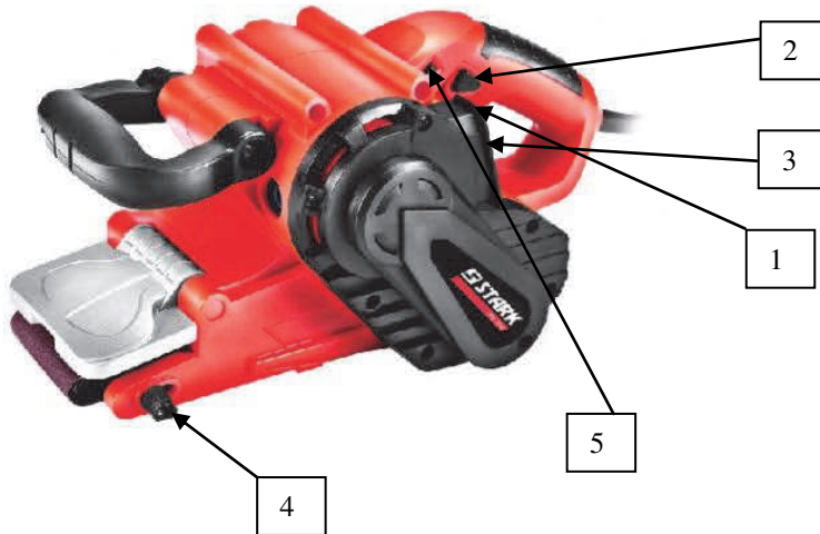
Фото 1 Загальний вид стрічкової шліфувальної машини