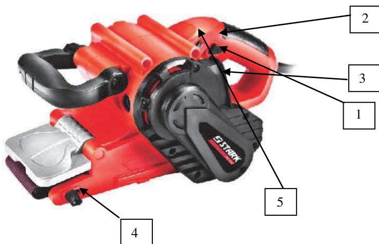
Фото 1 Общий вид ленточной шлифовальной машины